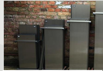
CONTROL DE STOCK