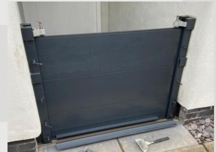
POWER COATING - PINTURA