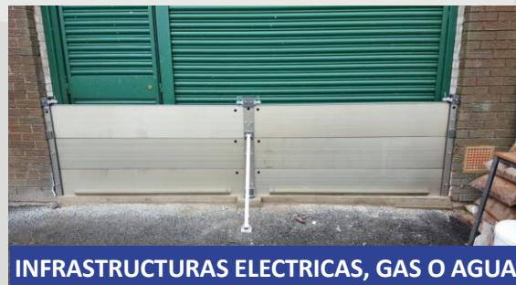
INFRASTRUCTURAS ELECTRICAS, GAS O AGUA