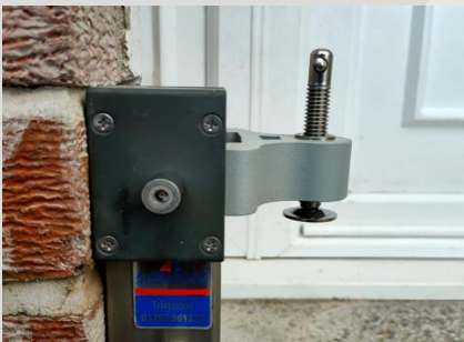
MECANISMOS DE BLOQUEO