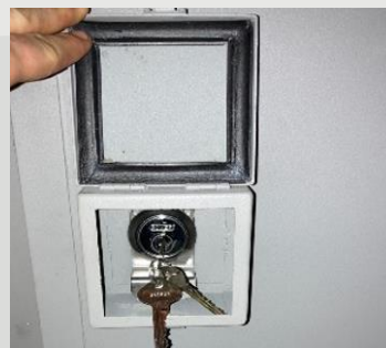
LLAVE & MANGO EN CUADRO WATERPROOF