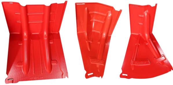
SIMPLE, MODULAR PIECES